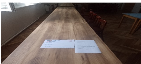
..... PO REALIZÁCII