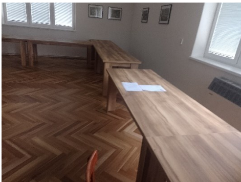
----- PO REALIZÁCII