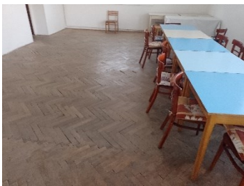
----- PRED RALIZÁCIOU