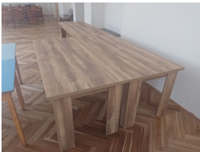
_____ PO REALIZÁCII